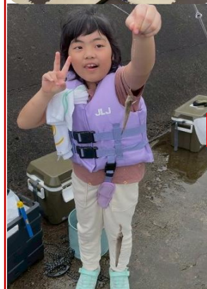
ダンス教室 さかな釣り